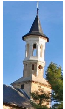
Clocher de la chapelle de St François de Sales (13014)

N otre dernière journée nous amènera à Brignoles, dans l'arrière pays varois. Nous pourrons profiter de ses rues enroulées autour de l'église principale mais aussi des connaissances des apprentis tailleurs de pierre qui nous initieront à leur Art ! Ils ont restauré entièrement les clochers des maisons de la Fondation d'Auteuil, (St François de Sales et Vitagliano.)