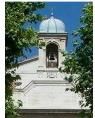
Clocher de la Chapelle de Vitagliano (13004)

Nous vous retrouverons à Vitagliano à 17h environ.